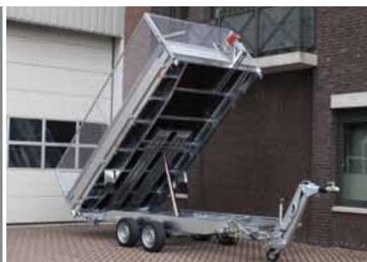
Foto 16: ► Afneembare lier steun met lier in combinatie met scharnierend voorbord