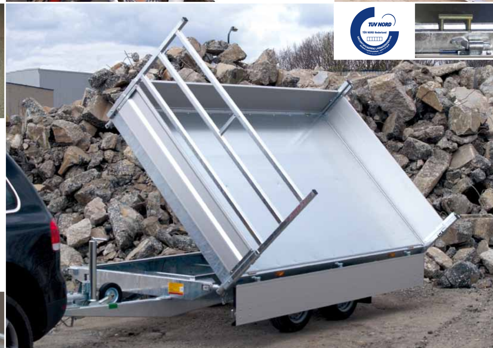
Foto 14 en 15: verhoogde aluminium bordes 400 of 500 mm. hoog, afneembare, aluminium opzetborden 300 mm. hoog, pendelende aluminium bordes 400 mm. hoog (afneembaar), (gas-) rekwerk op de zijwanden en ladingdoek (fijnmazig).